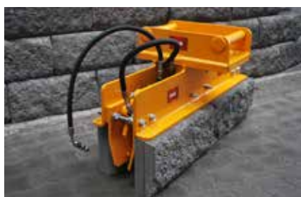
Løfteklype for Vertica